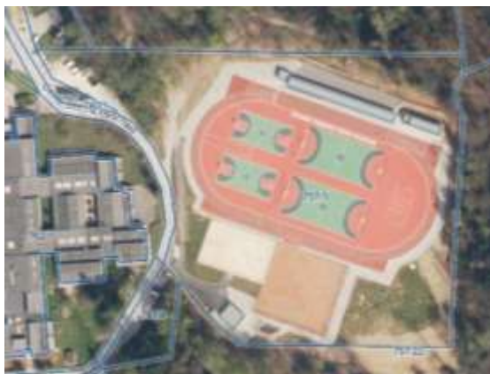
Slika 1: Skica parc. št. 757/3 k.o. 1810 - Stična, na kateri se nahaja gostinski lokal.

Skica, lokacija in tloris gostinskega lokala, ki je predmet oddaje v najem: