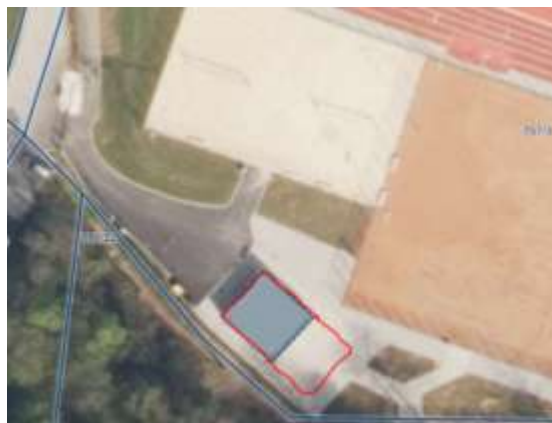
Slika 2: Lokacija stavbe št. 1730, kjer se nahaja gostinski lokal, ki je predmet oddaje v najem.