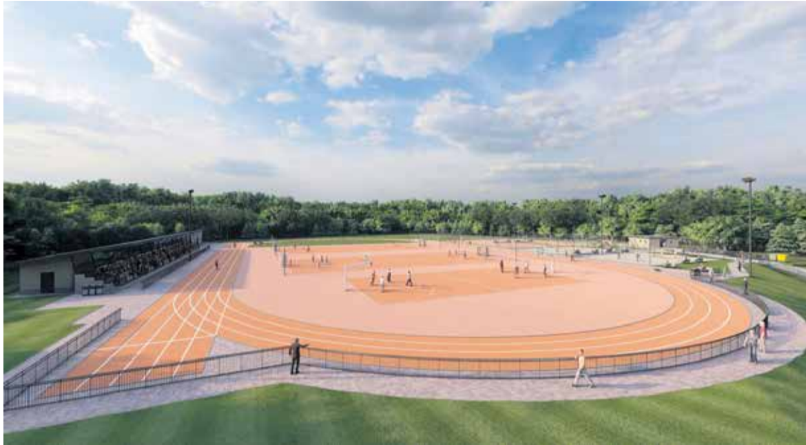
Športni park bo imel 300 metrski atletski krog, igrišča za roket, mali nogomet, košarko, odbojko in tenis ter površine za atletske discipline