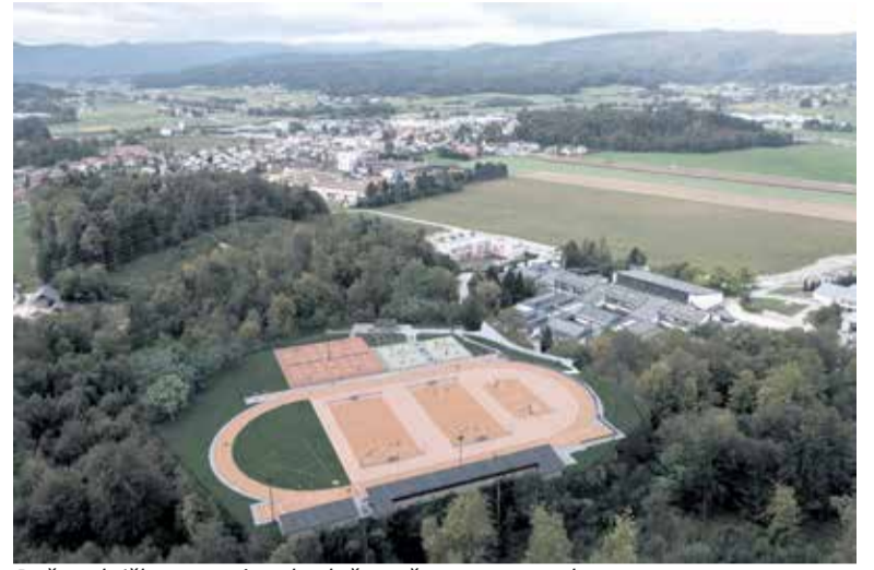
Računalniška umestitev bodočega športnega parka v prostor.