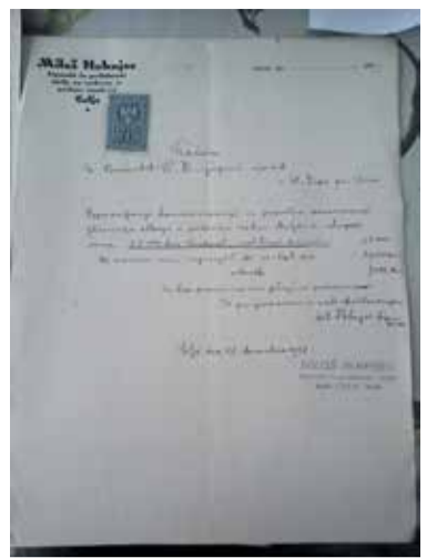
Račun za obnovo muljavskega oltarja iz leta 1928 iz šentviškega župnijskega arhiva

Leta 2007 je oltar obnovil Restavratorski center Zavoda za varstvo kulturne dediščine Slovenije. Restavratorski center je oltar prevzel v delo leta 2002. Njegova obnova je obsegala izvedbo natančnih predhodnih preiskav, zaplinitve oltarja, da so na ta način lahko uničili lesene škodljivce, restavriranje njegovih poškodovanih in manjkajočih delov. Med preiskavami so analizirali tudi posege, ki so bili na oltarju izvedeni med njegovimi obnovami leta 1928 in 1959. Obnova