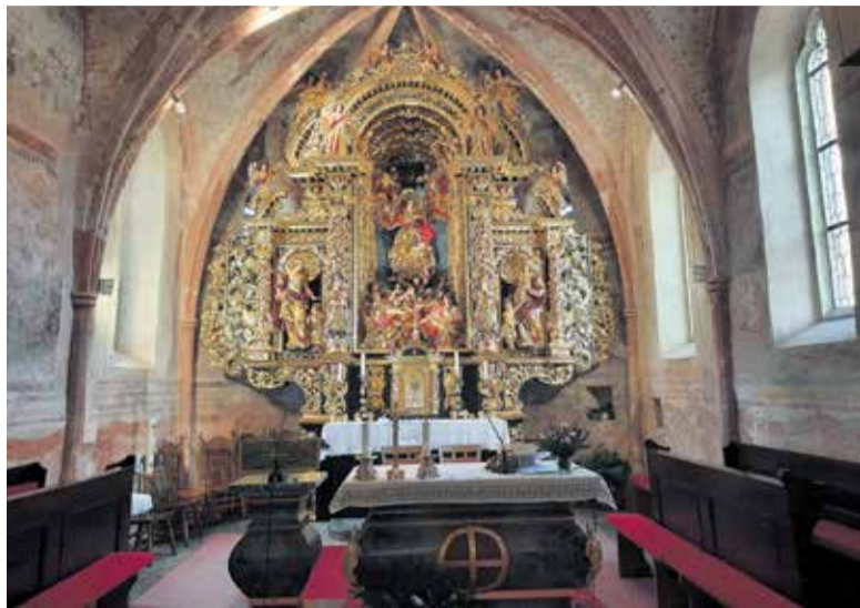
Zlati oltar v muljavski cerkvi.