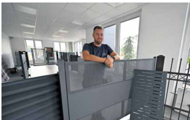
V novi poslovni stavbi v IOC Škrjanče ima podjetje Žugič tudi razstavni salon.

Malo manj je znano, da so obrtno poslovno zgodbo Žugičevih začela pisati dvizna garažna vrata. Bili so prvi pri nas, takrat še v skupni državi Jugoslaviji, ki so ponujali garažna vrata na daljinsko upravljanje. Pozneje so prvi razvili tudi daljinsko vodena samonosna dvoriščna vrata. Ko smo postali samostojna država, je trg ponudbe garažnih vrat z ali brez daljinskega upravljanja eksplodiral. Zato so se v podjetju bolj usmerili v svetovanje in izvedbo različnih kovinskih ograj in dvoriščnih vrat. Morda vas bo presenetilo, a pri njih ločijo med res veliko različnimi vrstami vrat in ograj. Poleg garažnih in industrijskih vrat izdelujejo še avtomatska krilna, samonosna, teleskopska, drsna in zgibno-drsna dvoriščna vrata za situacije, ko je za druga vrata premalo prostora. Dvoriščna vrata so pogosto kombinirana z osebnimi prehodi. Pravijo, da lahko za vsako situacijo na terenu najdejo ustrezno in optimalno tehnično in funkcionalno rešitev ter skoraj nešteto dizajnov in kombinacij materialov, da bi dosegli čim bolj unikaten videz. Podobna situacija je pri ograjah za notranja in zunanja stopnišča, balkone, terase, francoske balkone in vrtno oziroma dvoriščne ograje.