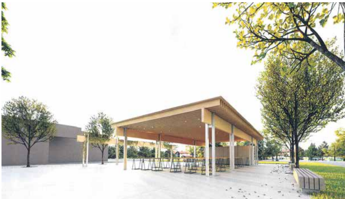
Vizualizacija bodoče tržnice pri banki